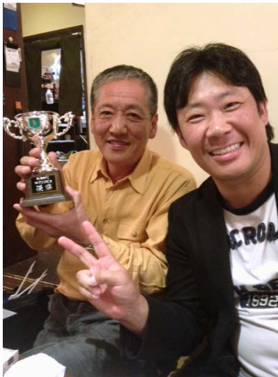
100回記念ゴルフ大会優勝 瀧会員と松本会員